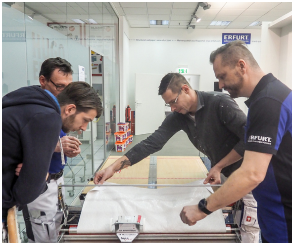
Tapezier-Action mit Know-how: Wie im letzten Jahr wird es auch bei der Meisterschaft in 2018 viele spannende Wettkämpfe zu verfolgen geben.