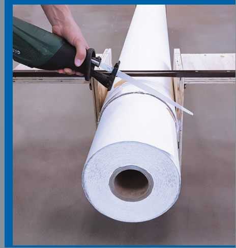
Die GIGA-Rollen können entsprechend der Raumhöhe individuell zugesägt werden.