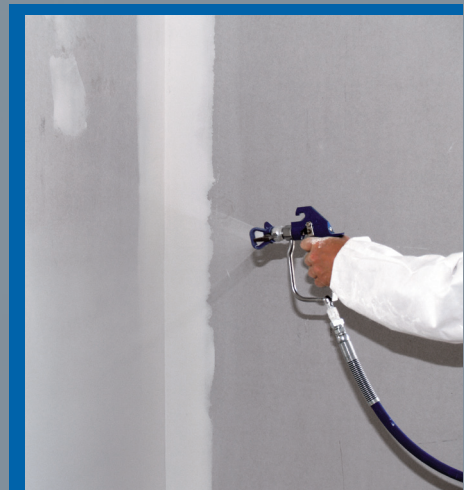
Der effiziente Kleisterauftrag erfolgt mit dem Airless-Gerät.