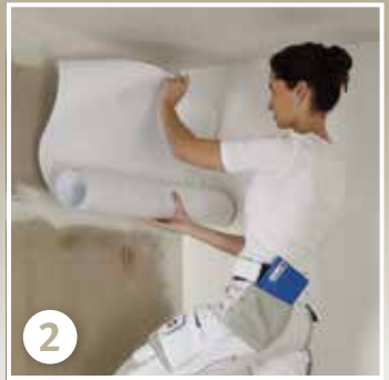
Tapetenbahn trocken ins Kleisterbett einlegen