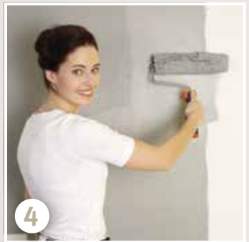
Wand streichen - fertig