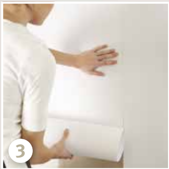
Nächste Bahn auf Stoß anbringen